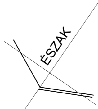
FÉLSZINT és PINCESZINT ALAPRAJZ TERVEZETT ÁLLAPOT