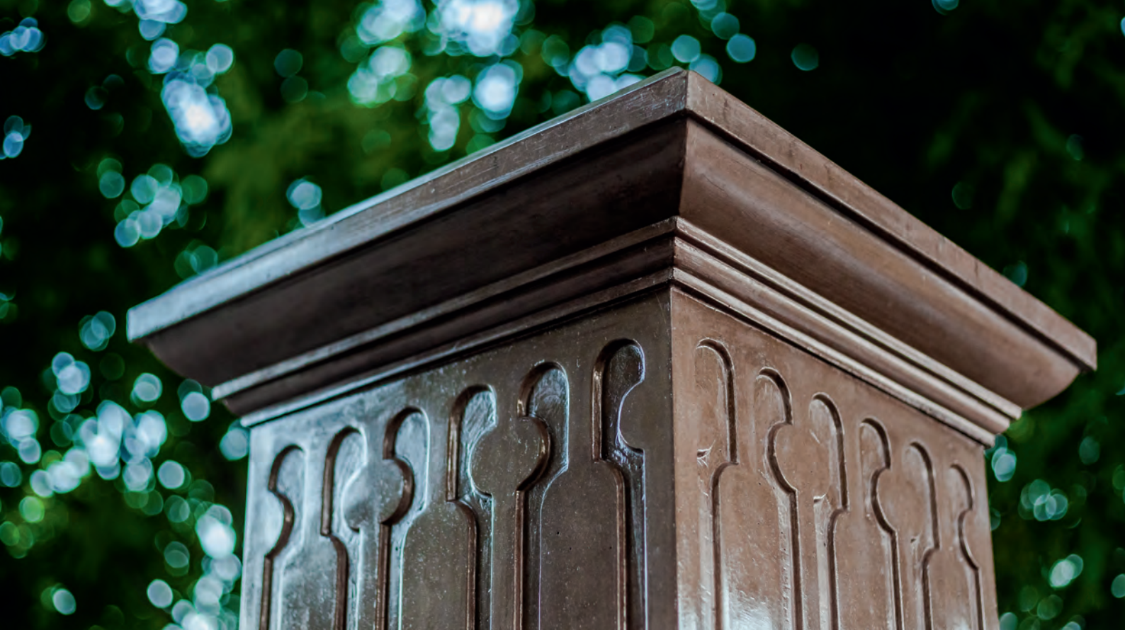
Referenciák a lajosmizsei temetőből Reference from the graveyard of Lajosmizse