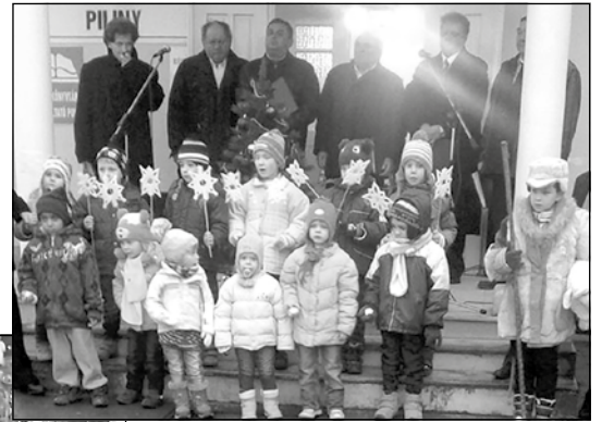
Falukarácsony Pilinyben december 22-én.