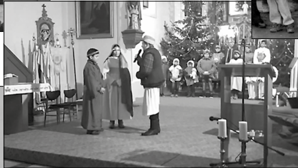
A karancssági felnőttek és gyerekek előadása december 24-én