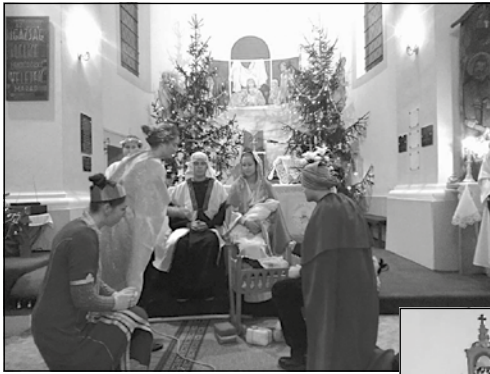
Szent László Közösség etesi előadása december 24-én