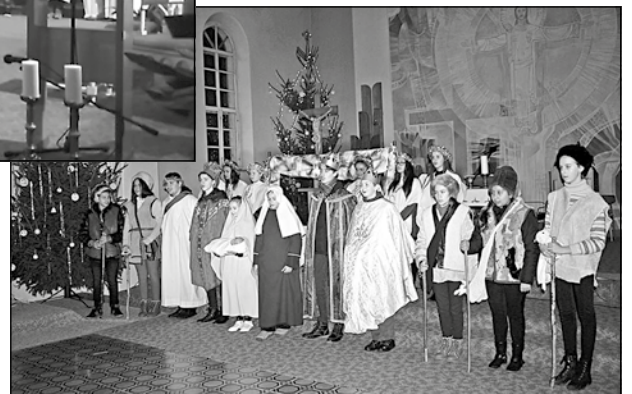
A gyerekek előadása december 25-én Ságújfaluban