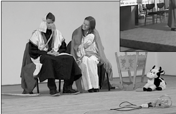
A Szent László Közösség szalmatercsi előadása december 22-én