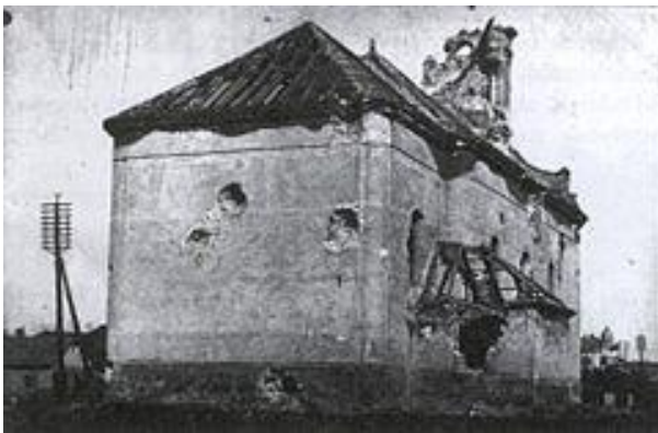
A szolnoki Vártemplom 1919-ben, a menekülő nyílással

Ebben az ostromállapotban a szolnoki Vártemplom tabernákulumában maradt az Oltáriszentség, míg a szentmisék már a ferences templomban folytak, a város némileg biztonságosabb felében. A Vártemplomot a lebombázás vagy a szétlövetés veszélye fenyegette, maga az Oltáriszentség is megsemmisült volna. „Legjobban aggódnak és bántja a Pátereket, hogy a tabernákulumban ott maradt a monstrancia és a cibórium tele átváltoztatott partikuláréval. Nagyon bántaná őket, ha valami tiszteletlenség érné a Jézuskát. Ezt kellene valakinek – ha van rá mód – elhozni...Hiába panaszkodott a Páter, vállalkozó nem akadt, mert lehetetlen volt átjutni a várba...Ettől az időtől mindig csak azon gondolkoztam, hogyan menthetném meg a Jézuskát, hogy lássa, én szeretem őt!” [G.E. 2003. p. 17.]